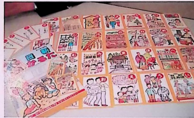
楽しいイラストと色彩の絵札

かるたは200セット作製。市内各公民館や地区の小・中学校等へも配布されます。(日新公民館にて頒布予定です。)