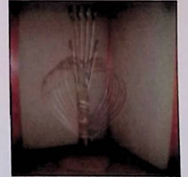
孔雀をイメージして