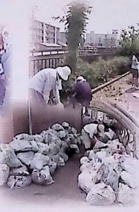
一斉清掃 7/8 (日)