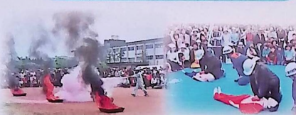
防災訓練 6/10 (日)