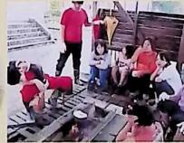
アウトドア(葡萄こわ作り)