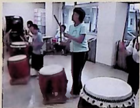
ミュージックアート(和太鼓)