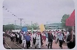
第30回記念 体育大会 5/20(日)