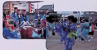
民謡大会 7/29 (日)