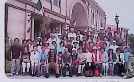
ふれあいツアー 6/3 (日) (イタリア村にて)