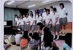
セタミニコンサート 7/7 (土) (仁愛女子高音楽科)