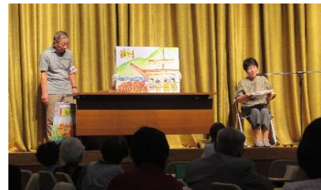
いきいきライフセミナー制作の紙芝居「福井弁 底喰川の大蛇」