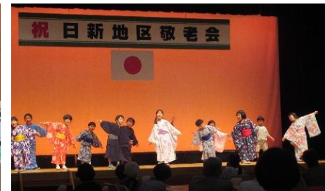
花園幼稚園園児によるかわいい浴衣姿のお遊戯「証城寺の狸ばやし」