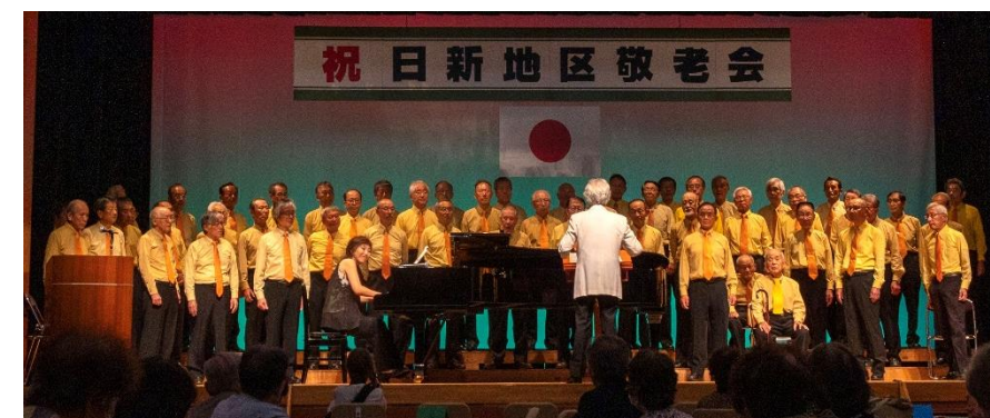
男声合唱団「ゴールデンエイジふくい」による50分近くの熱唱