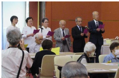
日新詩吟クラブの皆様による朗詠「米寿を賀す」