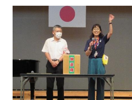
最後にお楽しみ抽選会で豪華賞品をゲット