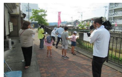
途中の各ポイントでクイズに解答。ケーブルテレビも取材中