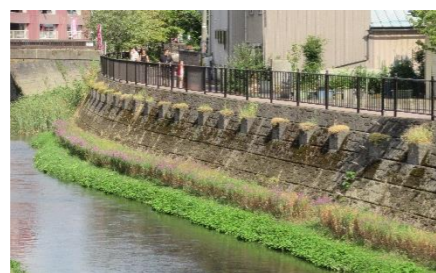
ミソハギ鑑賞ラリー。連日の猛暑でミソハギも若干ハトハト状態