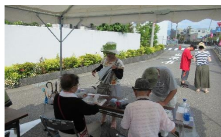
まず、受付をして(テントA)

8月6日(日)午後3時より開催されました。咲き誇るミソハギを地域の多くの方々に実際に見ていただくことにより底喰川清掃美化活動の継続と一層の発展を願って実施されているものです。参加者は136名でした。今年の新企画として、①「ミソハギ鑑賞&クイズラリー」と銘打ってミソハギ鑑賞コースの数か所でクイズに答えるポイントを設けたこと、②子どもたち用に輪投げコーナーを設けたこと、③焼き鳥販売を行ったこと等がありました。連日の猛暑同様午前中は熱い南風でしたが、始まる頃には北風に変わり奇跡的に過ごしやすい状態となりました。主催者の「まちづくり日新実行委員会」の皆様、関係者の皆様、ご苦労様でした。