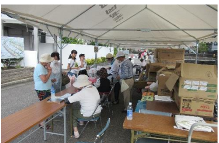
クイズ満点者は最後にじゃんけんでラッキー賞に挑戦(テントB)