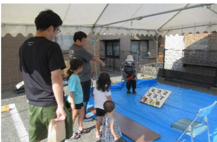
子どもたちは新コーナーの輪投げにも挑戦