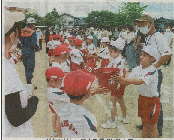
バケツリレーで水を運ぶ日新小学校の児童たち＝福井市の同校で

福井市の総合防災訓練が二十六日、市内各地であった。住民らが避難の動きを確認し、災害から身を守るための意識を高めた。昨年と一昨年は新型コロナウイルスの影響で中止となり、三年ぶりの開催。嶺北北部沖を震源に市内で最大震度7を観測する地震が発生し、家屋の倒壊や土砂崩れ、河川の堤防崩壊が起きた場合を想定した。