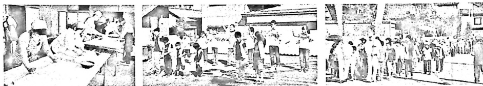
【写真左：旧館でのそば作り 中：附特生によるダンス 右：涼しい風に吹かれてウオーク】

※前日祭 10月15日(土)午後2時より実施されました。昨年までは午後3時開始でしたが、後片付けの時には暗くなってしまうため、1時間の繰り上げとなりました。附属特別支援学校生によるダンスと作品販売、底喰川ふれあいウオークとウオークDE五・七・五、そば愛好会によるそば、福引の順に実施されました。後片付けも明るいうちに出来ました。