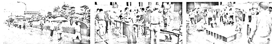
(写真左：一次避難所→ブロック防災会指揮所→日新小体育館へと移動 中：受付名簿の作成、右：各係の役割内容の確認後、段ボールベッド、イスの組立練習)

※災害時避難所運営模擬訓練 8月30日(日)午前8時より実施されました。参加対象者は防災支部長(自治会長)、防災要員、ブロック防災会役員、日新自防連協役員、各種団体長で、92名の参加がありました。