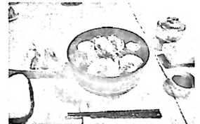
桶に入った名物料理