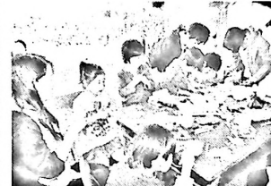
青年のお店に子ども達がたくさん