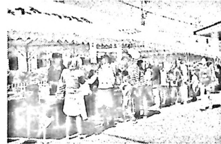
模擬店也大賑わい