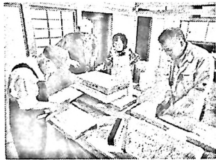
旧館でお蕎麦の準備

10月18日(土)午後3時より前日祭りが、翌19日(日)午前8時30分より当日祭りが実施されました。今年の新しい取り組みや出来事としては、①まちづくり日新環境部会による底喰川の草花や生き物の図が披露できたこと(本紙裏面に新聞記事を掲載)、②「写真の広場 in 日新写真展」で素人目コンテストを実施したこと、③IAGate(福井大学生からなる青年教育グループ)による模擬店(モノ作り体験&ゲームコーナー)が設置されたこと、④展示作品に福商美術部の作品が加わったことなどがありました。変わりやすいと言われる秋の気候にもかかわらず2日間連続で雲一つない晴天に恵まれ、大いに賑わった公民館まつりとなりました。ご協力くださいました皆様ありがとうございました。その一部をご紹介します。