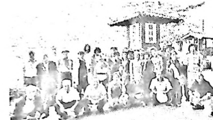
熊川宿で集合写真