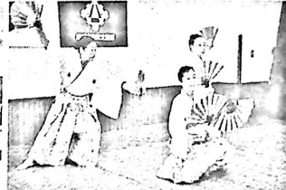
ポーズも決まって