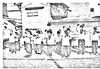
附属特別支援学校の皆さんの熱演