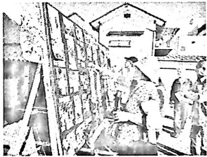
慎重に素人目コンテスト