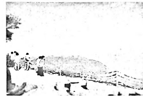
梅丈岳からの絶景

9月27日(土)、参加者34名(男性18名、女性16名)で実施されました。出発は早朝6時30分で、コースは、8:15 梅丈岳(レインボーライン)⇒10:00 蘇洞門めぐり遊覧船⇒11:00 御食若狭小浜食文化館⇒11:40 色彩館酔月(昼食)⇒12:55 若狭歴史博物館⇒13:55 熊川宿⇒16:20 人道の港敦賀ムゼウム⇒17:20 日本海さかな街⇒19:10 日新公民館着でした。快晴のもと、できたばかりの舞若道と若狭の自然、歴史、文化の魅力をたっぷり味わった一日となりました。