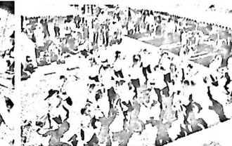
恒例の福大生による熱演

※公民館まつり写真注文受付中!(写真は公民館にあります) 締切11月20日(木) 受付先:日新公民館