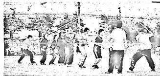
リズムを合わせて!