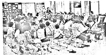
開講式で、スタッフの皆さんと顔合わせ

5月18日(土)午前9時より日新子ども教室の開講式が行われました。申込児童数は、茶道5名、華道14名、囲碁5名、将棋7名、日新ドリーム6名の計37名で、昨年度より3名の増加でした。開講式後それぞれの活動に、楽しく、熱心に取り組んでいました。(日新ドリームは、主に夏休みを中心に活動します)