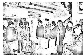
実行委員による受付

1月12日(土)午後5時30分より、参加者60名(新成人36名、小学校の恩師6名、スタッフ18名)で実施されました。今年の新しい取り組みとして、小学校の時の担任の先生方全員に参加していただきました(昨年までは6年生の時の先生のみ)