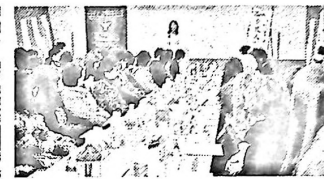
坪田先生より温かい挨拶