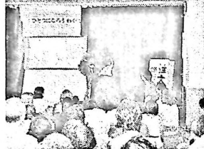
藤中美術部による影絵。「ブレーメンの音楽隊」と宮沢賢治作「注文の多い料理店」を観賞。美術部ならではの作り物で、年配者も小学生も楽しく見ました。