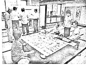
7/3 全体の構想図をみんなで知恵をしぼって