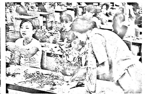
アドバイスを受けて、自分らしい生花を