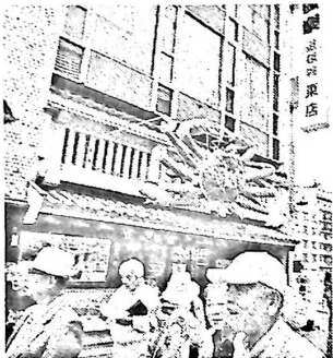
とてにぎやかでした

6月3日(日)、なにわ探検クルーズと花博記念公園鶴見緑地への旅が実施されました。参加者はバス定員一杯の45名でした。花博記念公園→昼食(明石焼き)→道頓堀散策→なにわ探検クルーズ(落語家の案内つき)のコースで、浪花の雰囲気をつぶり堪能しました。