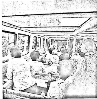
川船から浪速の街を楽しみました

(参加者の作品) (旅程順です) 初夏の風吹かれてバラの園をゆく トシボリを歩いて納得 喉い倒れの街 たのしみは 好日 好人 会い 集い なにわクルーズ 笑いに満ちとき 落語家となにわ探検 初夏の旅 浪花路の 汚い川も 気にならず 初夏の夕 真赤な夕陽 海に映え たまに会う 人とのつながり 深まりて