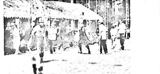
“根性レース”スタート(小4以上)

第32回日新区民体育大会開催 H22. 5. 16 老若男女、地区挙げての集い。新緑快晴の日和。 総合優勝は文里ブロック、種目別は、各ブロックが 分かち合い、無事終了できました。