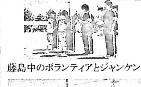
藤島中のボランティアとジャンケン