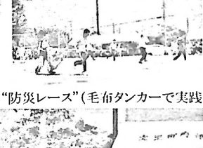
“防災レース”(毛布タンカーで実践)