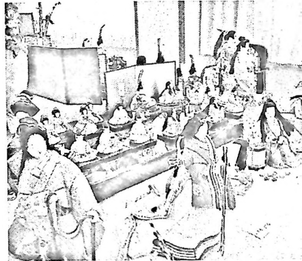
桃の節句を前に、雛人形が雅を競う 日新ギャラリー“春を呼ぶ木目込み人形展”より

公民館主事の配置基準では、地区人口5000人以上で3人とする案に、日新地区は該当し、勤務時間の増加もあり、勤務体制に変化がでることになろう。