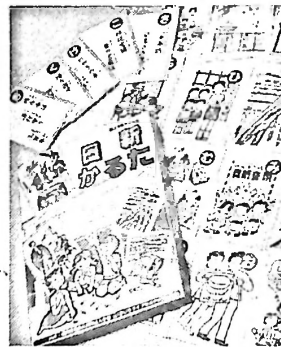
完成した“日新かるた”

成人学級(いきいきライフセミナー)の21年度事業に日新かるたづくりを決め、地区の皆さんの応募を元に、この程(2/25)完成をみた。日新の歴史、文化習慣などを読み込み解説書も付し、200箱の限定版製作。小学校などに配付し、残部があれば有償頒布予定です。