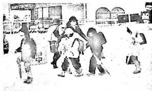
通学路を渡る日新小の児童たち

例年になく大雪となった今年は、凸凹 つるつるの雪道で大人ははらはら、子ども は元気に、はしゃぎもありで、こんな風景が あちこちの通学路でみられた。