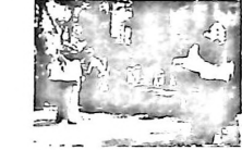
10月の秋祭り 各ブロックの伝統行事