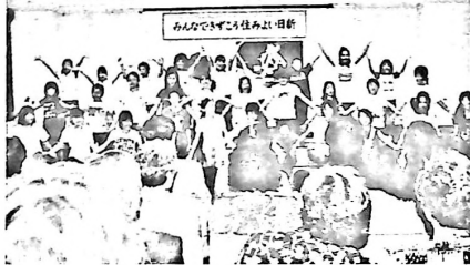
小学校合唱部の舞台発表