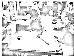
のし工程作業中の会員

日新ソバ打ち愛好会がここ数年ふれあいウォークの参加者に手打ちのおろしそばを提供している。愛好会自作のソバは10月の末刈り取り収穫、新ソバの試食が楽し。新しき蕎麦打って食わん坊の雨(夏目漱石)