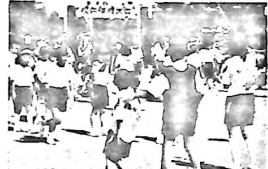
日新小 体育祭 10/1

10月、11月は、体育、文化そして伝統行事、芸術、味覚、読書、 収穫の秋と言われ、人と自然が最も融合する時期。大小様々なイベント まつりがつづく。(公民館まつりスナップ写真ご希望の方は14日までに公民館へ)