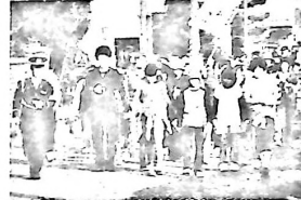
前日祭10/17 ふれあい ウォーク

10月、11月は、体育、文化そして伝統行事、芸術、味覚、読書、 収穫の秋と言われ、人と自然が最も融合する時期。大小様々なイベント まつりがつづく。(公民館まつりスナップ写真ご希望の方は14日までに公民館へ)