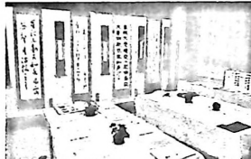
公民館自主グループの発表 写真は 書道部 作品展