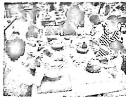
陶芸を楽しむ親子